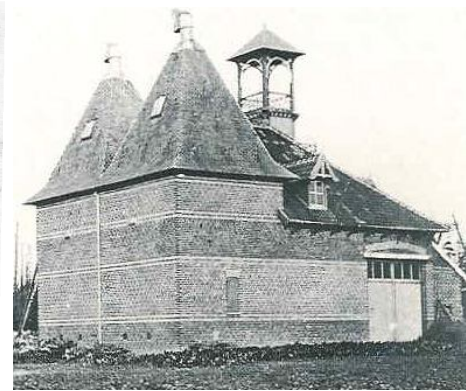
Krombeke (B) hopast naar Engels bestek, plm. 1900