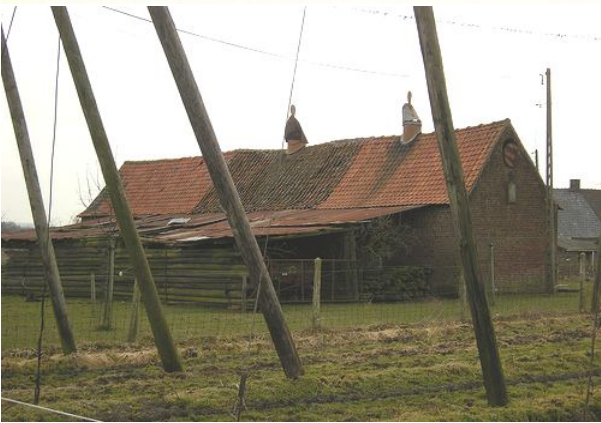
Poperinge (B) hoeve met hopast, beschermd sedert 2009