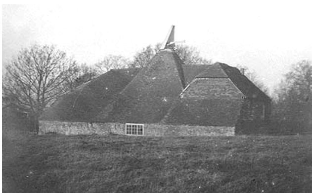
East Sussex (GB) oasthouse