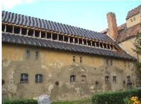
Görlitz, Saksen (Dld) 1861. Volledige restauratie van het landgoed 'Loensches Gut' 2006-2008