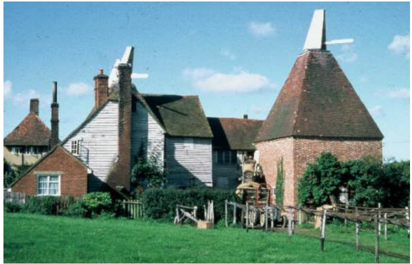
Catham, Kent (GB) 1814